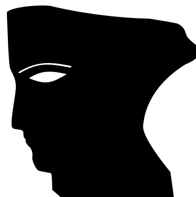
TROPHÉE CÉSAR & TECHNIQUES

2019 - POLY SON POST PRODUCTION 2018 - MIKROS IMAGE TECHNICOLOR 2017 - TAPAGES & NOCTURNES 2016 - M141 2015 - POLY SON POST PRODUCTION 2014 - TRANSPALUX 2013 - MIKROS IMAGE 2012 - MIKROS IMAGE 2011 - ARCHIPEL PRODUCTIONS